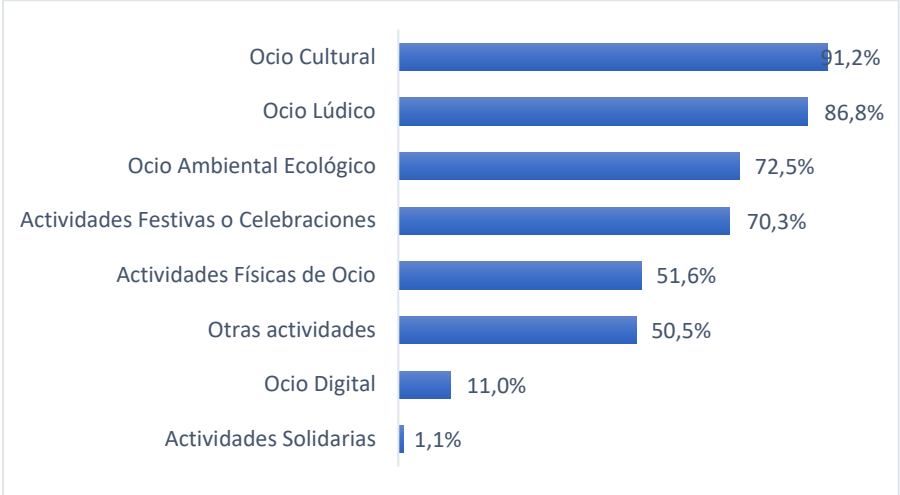
Figura 1. Tipos de actividades de ocio compartidas entre abuelos y nietos adolescentes

El ocio cultural compartido entre abuelos y nietos es fundamentalmente ocio de hogar. Ver la televisión es la actividad cultural más compartida entre abuelos y nietos (70,3%) a casi 30 puntos porcentuales se encuentra escuchar música (42,9%). Leer y hacer actividades artísticas son las otras dos actividades culturales más compartidas.