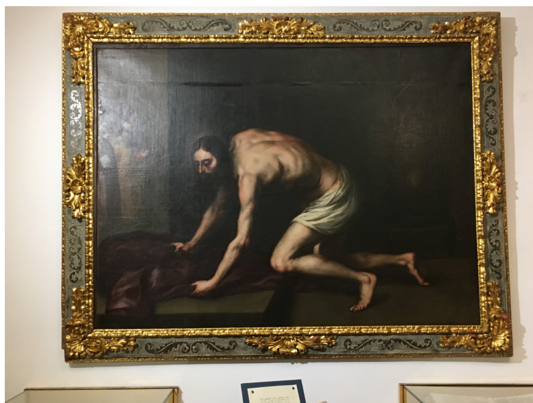
Fig. 4. Cristo recogiendo sus vestiduras (S. XVII). Pedro Atanasio Bocanegra (atribuido). Convento de la Concepción.