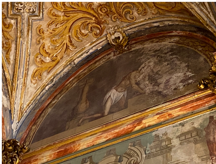
Fig. 2. Cristo recogiendo sus vestiduras (1729). Martín de Pineda. Iglesia de san Miguel Bajo.