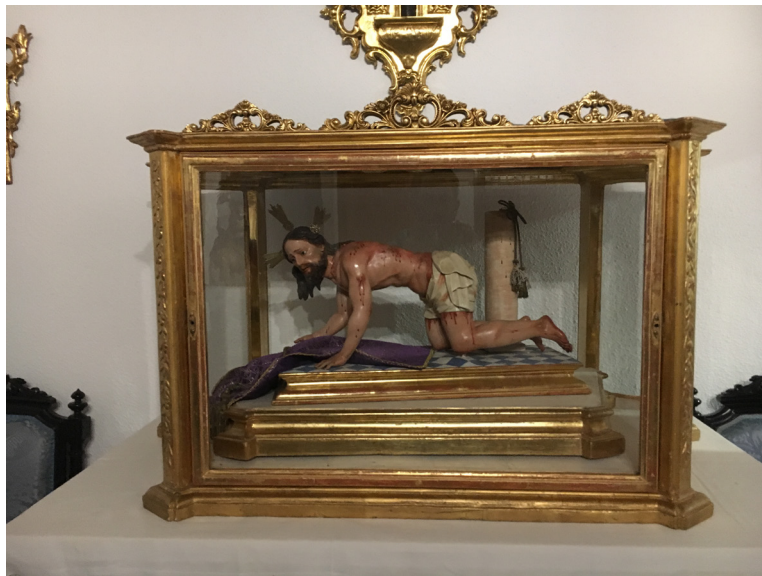
Fig. 1. Cristo recogiendo sus vestiduras (s. XVIII). Convento de la Concepción.